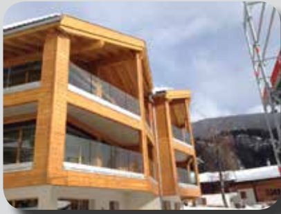
Blatten bei Naters im Wallis – Problemlose Montage bei geringen Temperaturen!